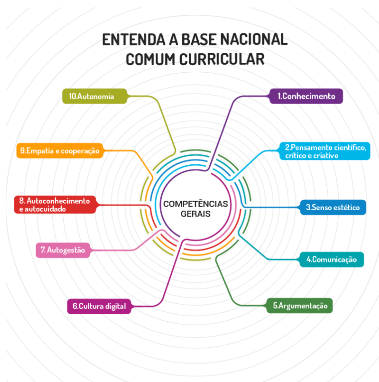
Figura 3: Dez competências gerais da BNCC