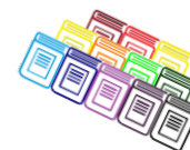
Figura 1: O futuro dos buscadores.