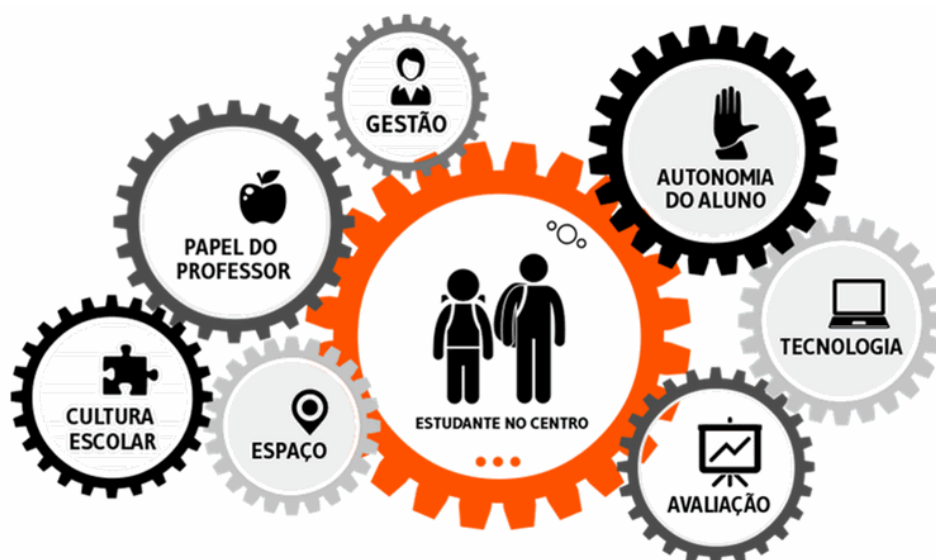
Figura 4: Ensino híbrido

Fonte: Bacich, NETO e Trevisan. Ensino Híbrido. p. 24, 2015.