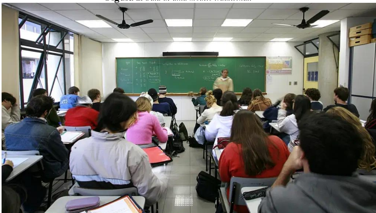
Figura 2: Sala de aula modelo tradicional.

Imaginemos uma sala de aula hoje. Na imaginação da grande maioria a cena pensada envolveria, a maioria dos alunos dispostos em carteiras enfileiradas, o professor ao centro da sala, uma mesa do professor próxima a este professor e ao fundo, um quadro de giz ou um quadro branco. Essa realidade independe de a escola ser da rede pública ou privada, pois ainda persiste esse modelo. A pergunta que fica é: quando surgiu esse modelo e principalmente, por que ele ainda prepondera?